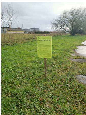
Site du Petit Raidit