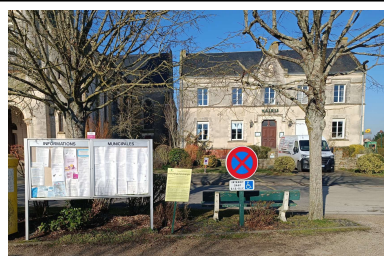
Mairie de St Ouen en Belin