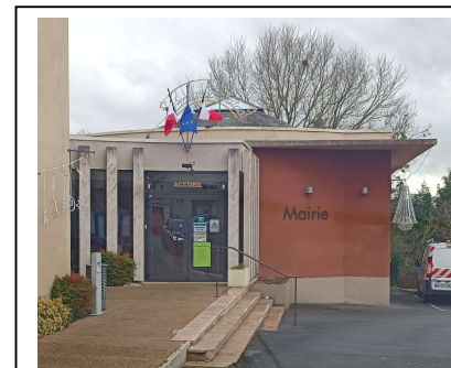
Mairie de Moncé en Belin