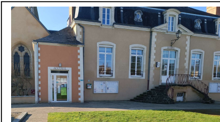
Mairie de St Biez en Belin