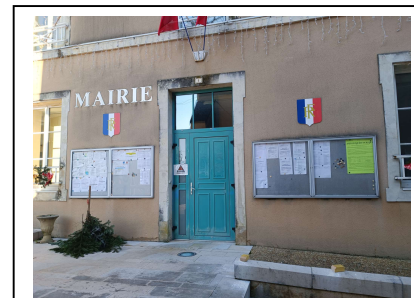
Mairie de Marigné-Lailié