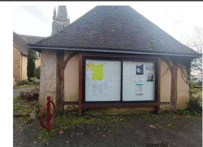
Mairie de Saint Gervais en Belin