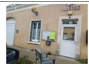
Mairie de Téléché