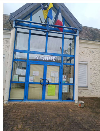
Mairie de Laigné en Belin